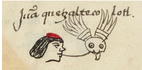
Figura 1. Representación del glifo Quetzaltecoltl asociado al personaje Juan Quetzaltecoltl

Fuente: “MH: ATENCO - 387_661v”, Tlachia , Contextos Pictográficos del Náhuatl, UNAM. La figura está tomada, por su calidad, de Matrícula de Huexotzinco , f. 661 v., Library of Congress. https://www.loc.gov/item/2021668124