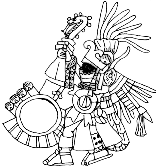
Figura 2. Huitzilopochtli con el atlatl en forma de xihcoatl

Fuente: redibujado por la autora a partir de Códice borbónico , lámina 34.