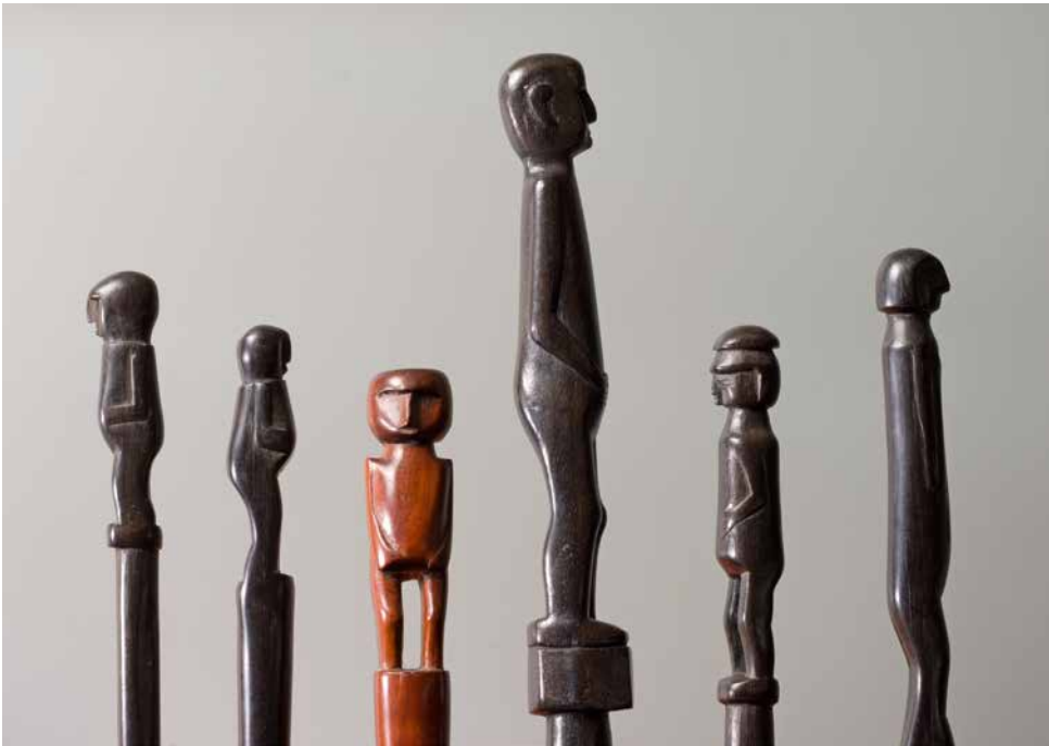
Figura 1. Bastones chocó, Colombia