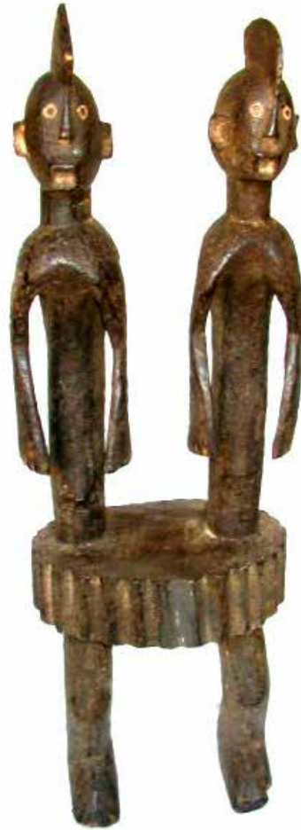
Figura 7. Escultura chamba mangki mesë