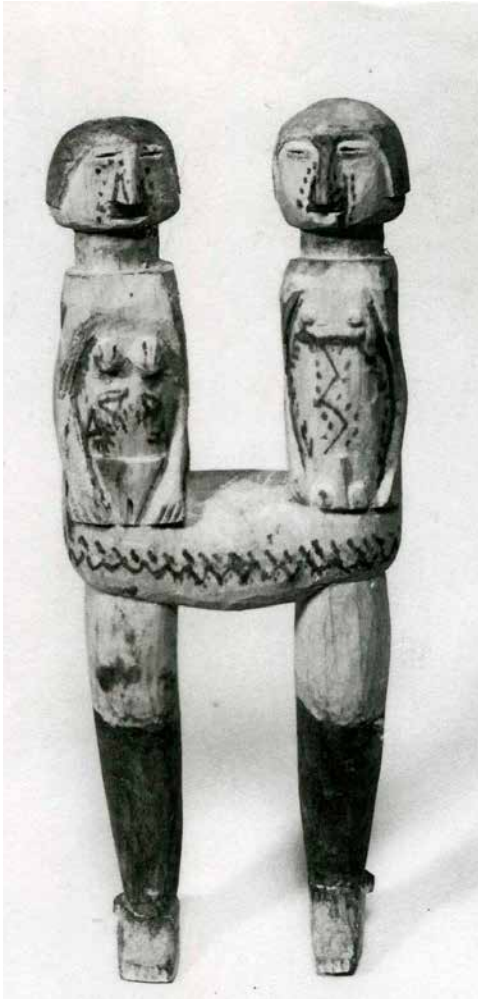
Figura 6. Escultura chocó páchaidammeisa ("solo una pierna")