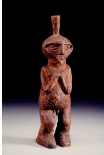
Figura 5. Bastón con representación espíritu de difunto. Ovinbundo, Angola