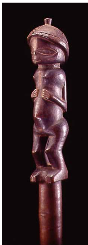
Figura 3. Bastón cokwe, Angola