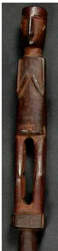
Figura 2. Bastón chocó

Fuente: colección Museo de las Culturas del Mundo, Gotemburgo, Suecia, 1927, registro 27.0495.