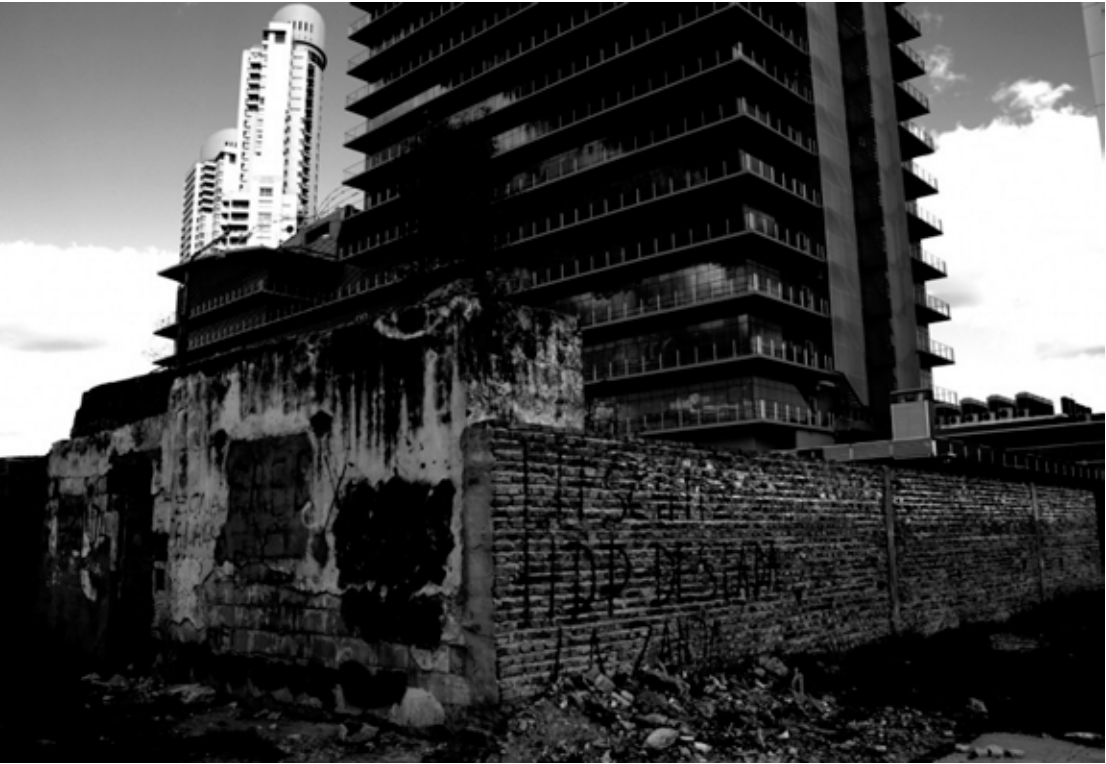
Figura 3. Torres Dolfines y adyacentes, de día, vistas desde abajo. Incluye terrenos que aún son materia de especulación inmobiliaria