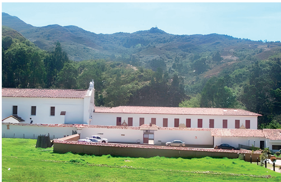
Figura 4. El convento, el cerro y, en el medio, muchos desechos