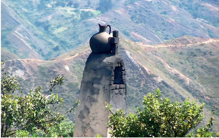
Figura 2. Copa de la chimenea del horno