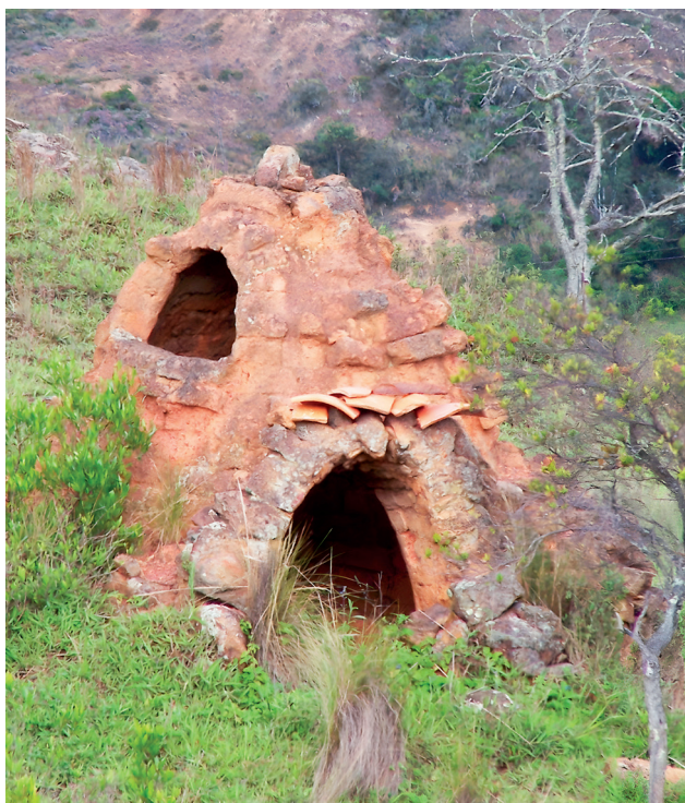
Figura 3. Horno de los antiguos

Los ceramistas actuales se refieren a los hornos que coinciden en sus rasgos con los hornos reportados por estas investigadoras en los setenta como “hornos de los antiguos”, y es común verlos abandonados, como ruinas en el paisaje (figura 3). Algunos de estos también están presentes en los talleres actuales. Aunque no son usados para cocer, siguen empleándose para almacenar vasijas crudas o cocidas, o como refugio de mascotas. Del mismo modo, se refieren a los fragmentos cerámicos en superficie asociados a estos hornos como “loza de los antiguos”, y se anota la diferencia en cuanto a la pasta, la materia prima y el tipo de cocción que se puede identificar a partir de estos fragmentos y en comparación con la cerámica actual.