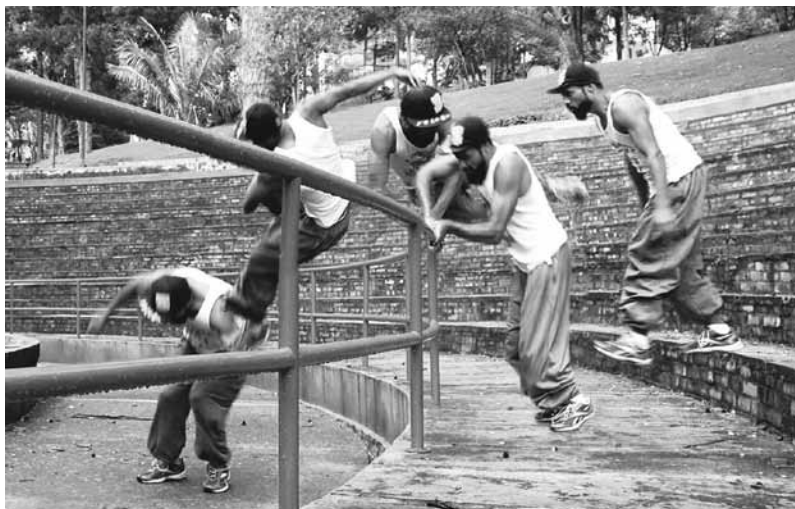
FOTOGRAFÍA 1. SECUENCIA QUE ILUSTR A EL MOVIMIENTO DENOMINADO REVERSO , EJECUTADO AQUÍ POR CHANGO EN EL PARQUE DE LA INDEPENDENCIA