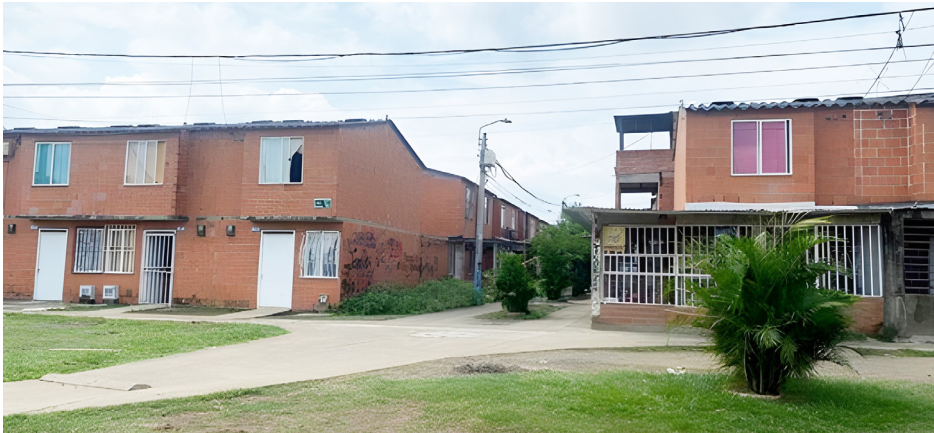
Figura 2. Fachadas de las casas en Llano Verde, 2022