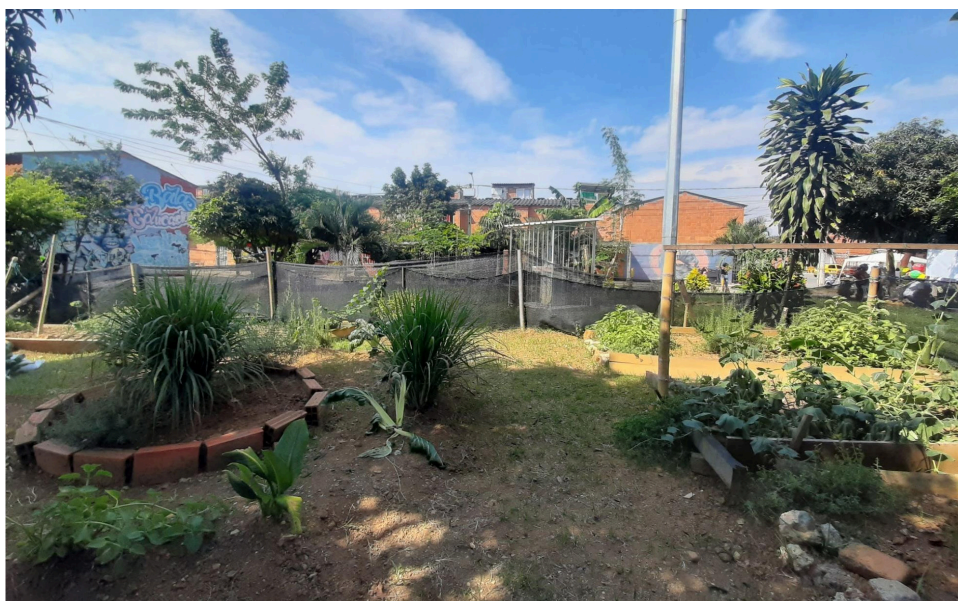
Figura 3. Huerta Sanando Heridas, 2022

La huerta es una respuesta de autogestión de la comunidad frente a la institucionalidad, ya que, durante la socialización de entrega de viviendas en el 2013, la Secretaría de Bienestar Social restringió el uso del espacio solo como zona verde. Al principio, las personas se enfrentaron a un suelo improductivo en el que proliferaba la maleza. En el 2022, la comunidad tomó la iniciativa de delimitar el lugar para la huerta utilizando tierra fértil y retomando conocimientos rurales con el fin de obtener autonomía alimentaria y adaptar los modos de vida de una territorialidad pasada como un “referente de ser y hacer en el mundo” (Ocampo Pardo y Martínez Carpeta 2014, 114). La apropiación implicó fertilizar el suelo para, posteriormente, sembrar plantas medicinales y condimentarias, como espinaca, limoncillo, acelgas, ají, lechuga, pimentón, coliflor, perejil, orégano y apio (figura 3).