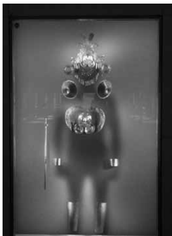
FOTOGRAFÍA 4. “CACIQUE” EN EL MUSEO DEL ORO

Pero el contenedor tiene grietas. Otras voces luchan en medio de las líneas y a través de las vitrinas. Estoy pensando, en particular, en una figura fantasmal: la sombra del “cacique” superpuesta con artefactos dorados señalados como “símbolos de poder” (fotografía 4). Parece que todo lo que queda de la historia indígena son momentos metálicos arrancados de un cuerpo indio anónimo. Están recreados en un presente sin rostro; poder contenido, poder transferido. Otro ejecutante disfrazado. Aunque intencionalmente mudo, no puede no hablar. ¿Es esta la respuesta a la pregunta “quiénes somos”?