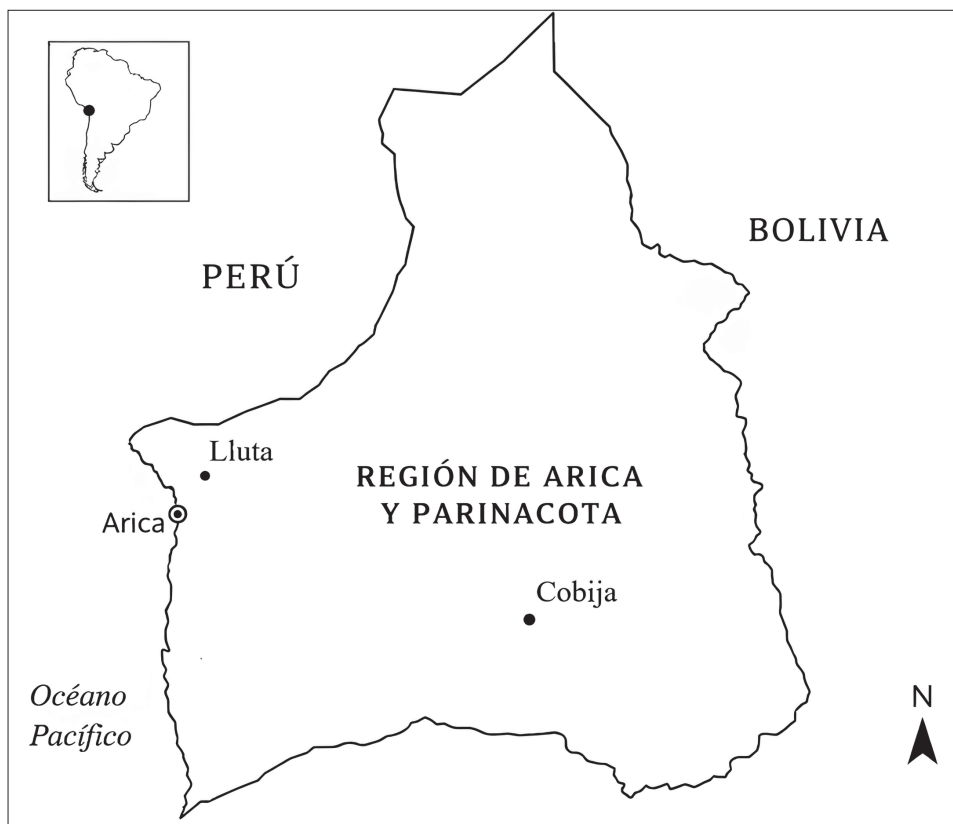
Figura 1. Localizaciones entre las que se desplazaban frecuentemente las mujeres del estudio: Cobija, Arica y el valle de Lluta