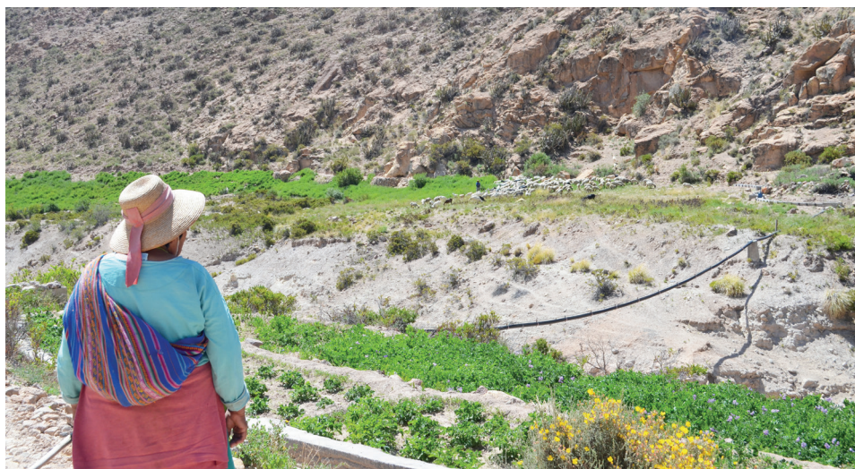
Figura 2. Ganadera observando a distancia la alimentación de sus animales mientras su marido ejecutaba el pastoreo en los alfalfaes

eran llevados por las ganaderas hacia zonas abiertas cercanas al corral, en las que había disponibilidad de especies vegetales silvestres ( monte ) y en donde les fijaban límites espaciales o los ataban con sogas mientras se alimentaban. Estos ajustes son interesantes en la medida en que reflejan que la economía ganadera aymara no concibe una edad específica para que una mujer deje de pastorear —y criar animales—; más bien, se considera que puede envejecer en el ejercicio de su trabajo e imaginarse a sí misma haciéndolo activamente hasta los últimos días de su vida, aunque ello implique adaptaciones técnicas.