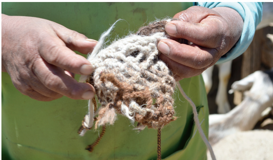
Figura 3. Ganadera con un ñoco que ella misma ha trenzado

Sacar leche era asimismo modular el consumo de las crías y de los maltoncitos (animales jóvenes) que aún estuvieran mamando ( mamones ). Para ello, la primera técnica que utilizaban era la de ñoquear (poner bozales) y apartarlos del resto de