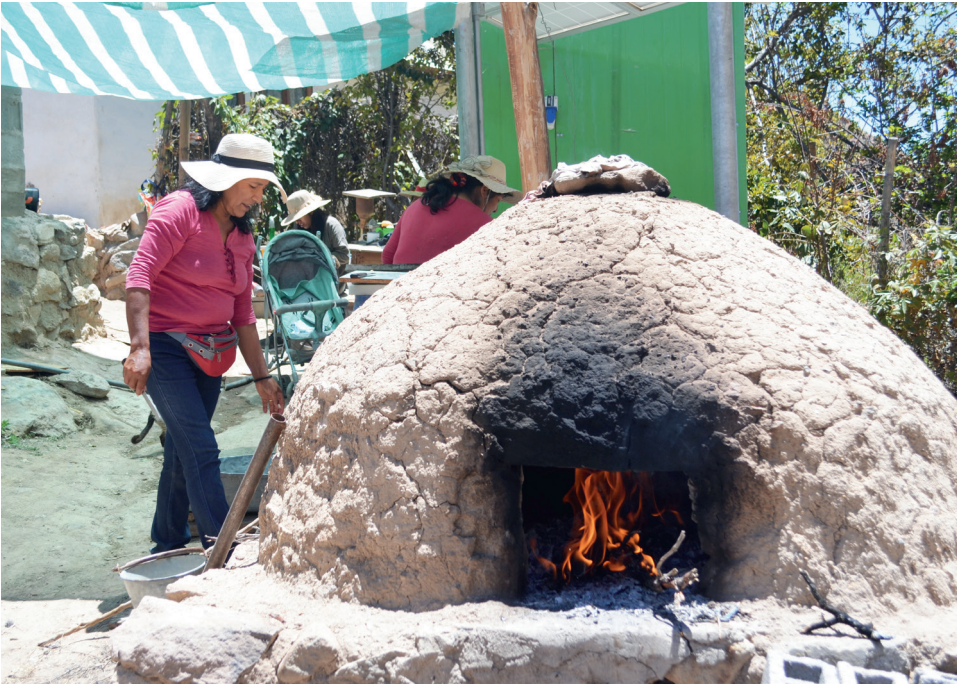
Figura 8. Hijas cocinando en festividades de relevancia para sus madres