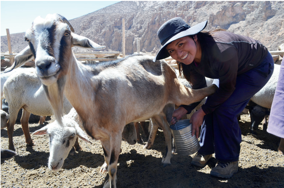
Figura 7. Hijas ayudando en el trabajo de ganadería