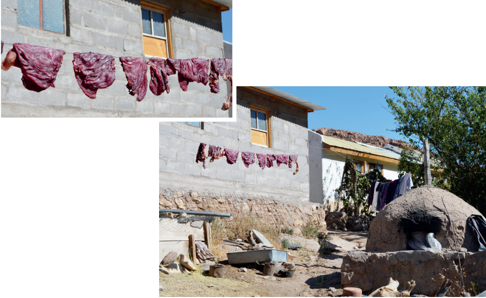
Figura 5. Charki de caprino en proceso de elaboración