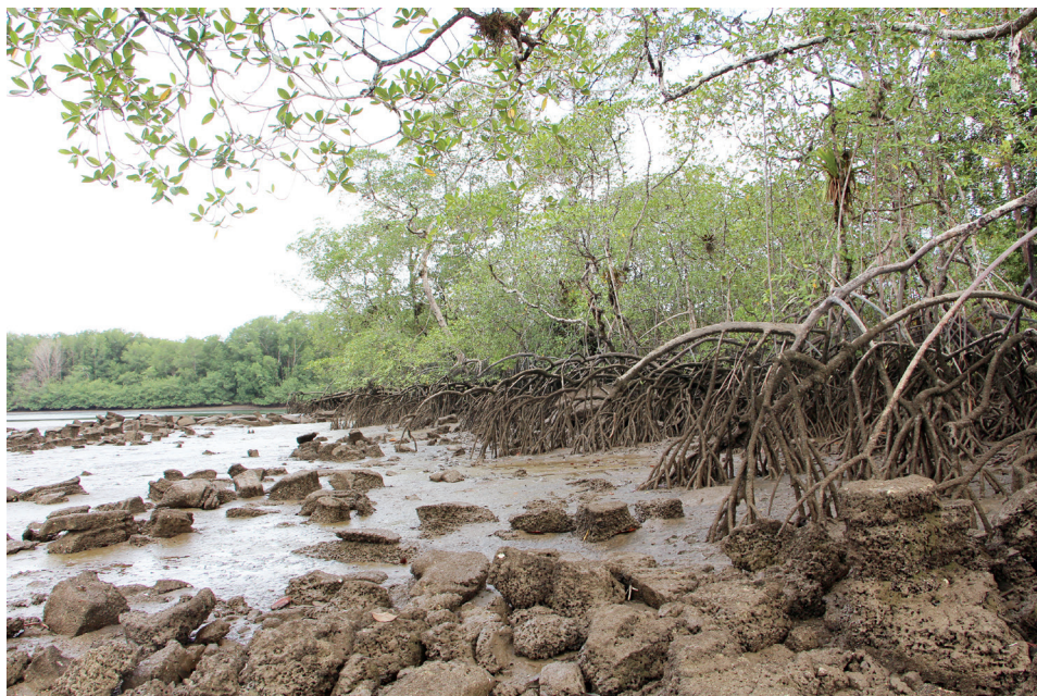
Figura 2. Playa en marea baja, 2023