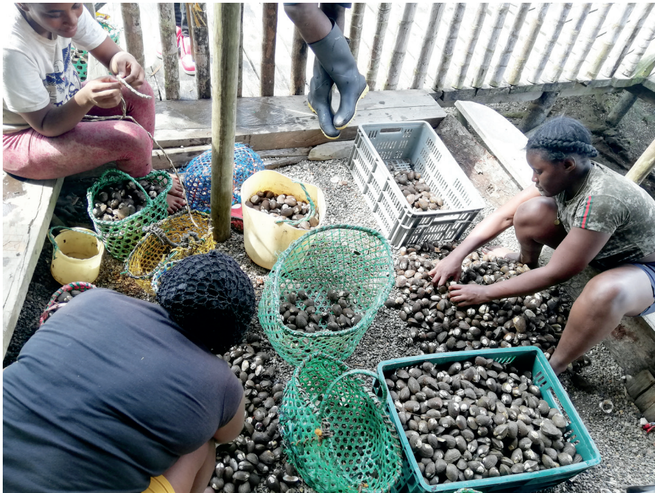
Figura 7. Quincheras contando y seleccionando la piangua del día, Mangaña, abril de 2023