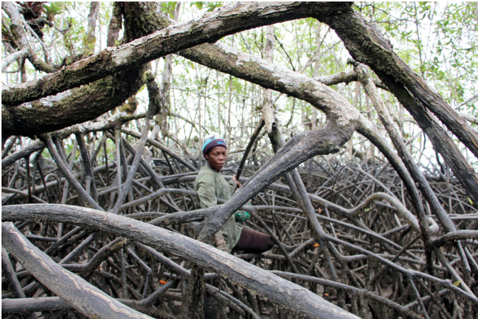
Figura 3. Colombia en el manglar. Bahía Málaga, abril de 2023

Para subsistir en el Pacífico colombiano, las personas realizan simultáneamente varias actividades económicas que fluctúan de manera dinámica, vinculadas a los periodos de la caza, la tala, la pesca, la agricultura y la recolección de cangrejos y moluscos. A esta organización, el antropólogo Eduardo Restrepo (1996) la denominó polieconomía . Estas actividades están relacionadas y configuran sistemas productivos poliactivos que generan la apropiación de una diversidad de espacios, como el mar, la playa, los ríos, los estuarios, el bosque y los manglares (véase también Gutiérrez et al. 2022). Dichas tareas son llevadas a cabo por todos los miembros de la comunidad, sin una división del trabajo especializada, salvo la división sexual. En Bahía Málaga, se espera que cada persona esté en capacidad de desempeñar cualquiera de estas labores; de hecho, un componente central del proceso educativo consiste en transmitir a las nuevas generaciones el conjunto de habilidades que ellas exigen.