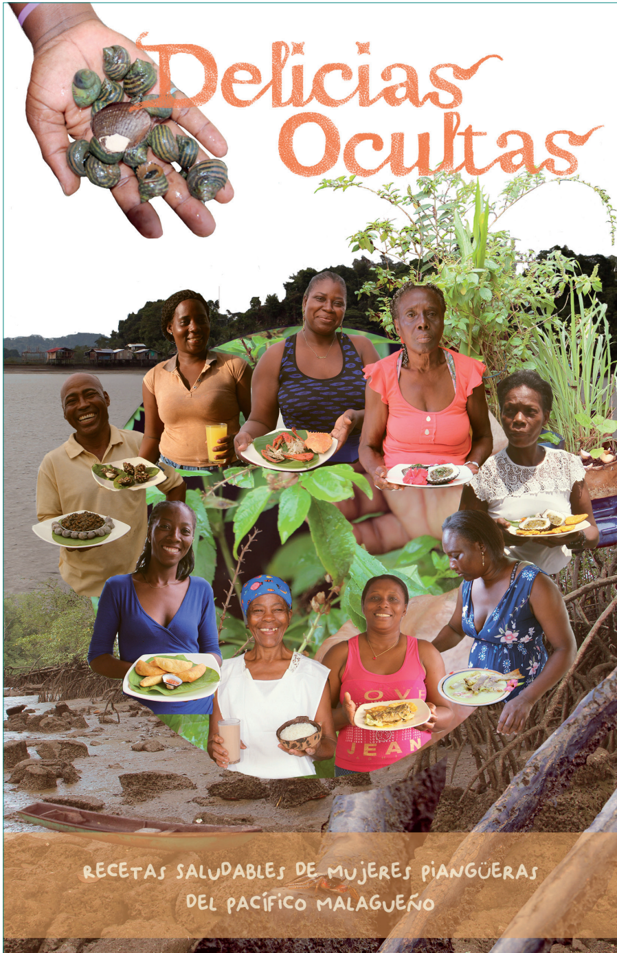
Figura 1. Portada del recetario realizado en el trabajo de campo