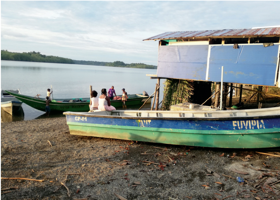
Figura 8. Llegada del intermediario para la compra de piangua, abril de 2023

pues este producto se comercializa vivo y debe llegar a su destino (Ecuador generalmente) en un plazo máximo de quince días desde su recolección (figura 8).