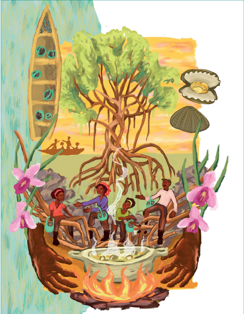
Figura 11. El festejo de la piangua, el manglar y la comunidad

Fuente: Fuvipia (2023), ilustración de Paula Castro.