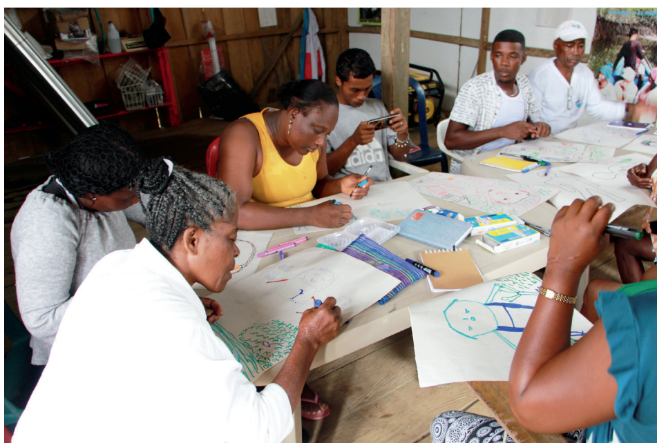
Figura 9. Taller de Mapeo del Cuerpo-Territorio, 2023