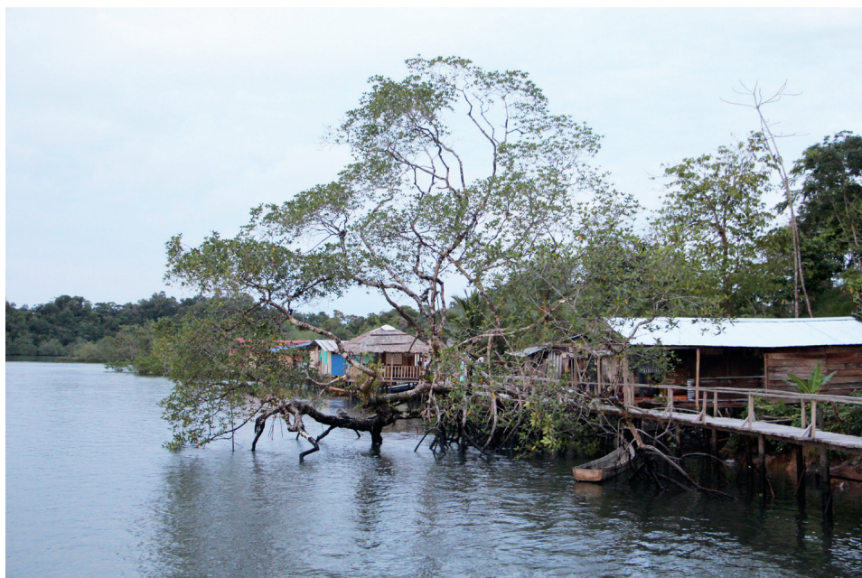
Figura 4. Casas palafíticas en Mangaña, abril de 2023

Las comunidades negras del Pacífico están acostumbradas al movimiento como parte constitutiva de la vida orillera; las poblaciones de manglar son itinerantes y sus habitantes han residido en distintos puntos del litoral a lo largo de su existencia (Leal 2000). Las casas palafíticas reflejan esta impermanencia, pues pueden desmontarse y trasladarse según las necesidades de sus habitantes (figura 4).