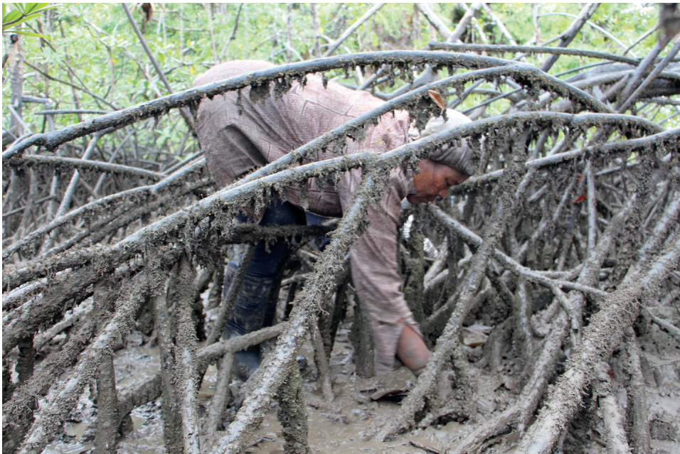
Figura 10. Esperanza pianguando entre las raíces del manglar, 2023

institucionalidad estatal y la cooperación internacional, estas organizaciones suelen ser interpeladas con discursos empresariales que promueven su formalización y “cooperativización” como estrategia para hacerlas sostenibles, trasladando así la responsabilidad del cuidado a las comunidades y perpetuando la histórica irresponsabilidad del Estado en la garantía de derechos. Este enfoque induce a cuidadoras y cuidadores comunitarios a desplazar cosmovisiones de interdependencia y solidaridad en favor de marcos centrados en la prestación de servicios, el emprendimiento y la innovación. Si bien existe una necesidad real de generar ingresos para la subsistencia, esta exigencia provoca tensiones profundas entre las lógicas del cuidado, el trabajo y la reproducción de la vida.