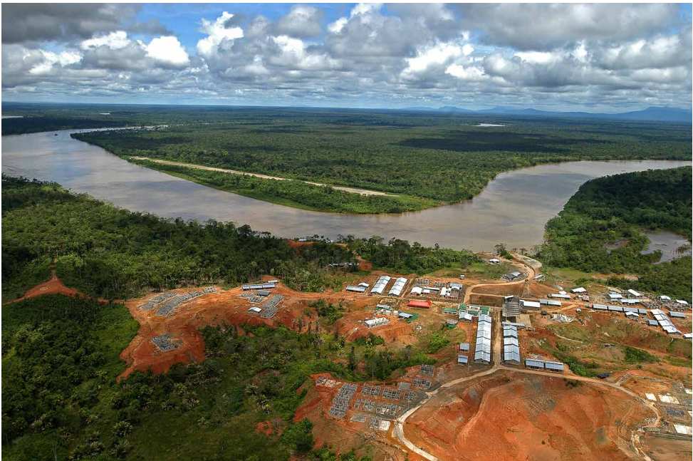
Figura 1. Imagen panorámica de Bojayá, Choco (Bellavista Nuevo en construcción)