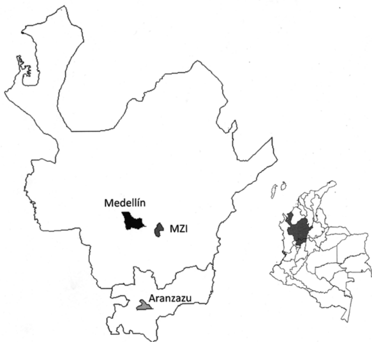
FIGURA 1. LOCALIZACIÓN APROXIMADA DE POBLACIONES

consanguíneamente (por lo menos hasta tres generaciones) y que por lo menos cuatro de ocho ancestros fueran de origen local. Todos los individuos incluidos en este estudio firmaron un consentimiento informado y la aprobación ética fue proporcionada por el Comité de Ética de la Universidad de Antioquia.