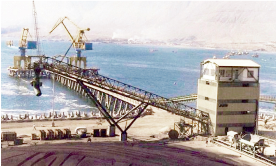
Figura 4. Vista desde el sur del puerto de descarga de carbón, 1985