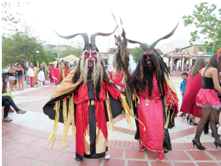
Figura 5. Diablos, 2014