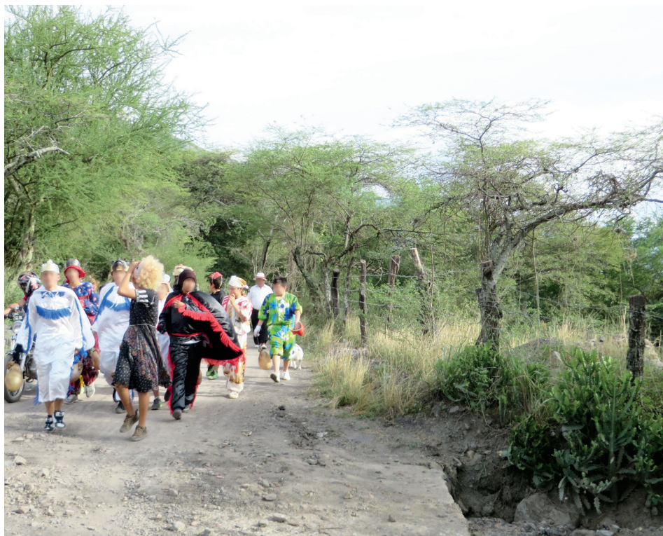
Figura 24. Gavilla de matachines bajando de la vereda El Datal, 2014