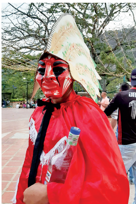
Figura 9. Pielroja, 2021