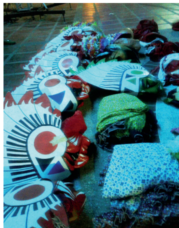
Figura 22. Caretas en el suelo del parque, 2017

A las seis de la tarde, tal vez por las altas montañas que rodean a Capitanejo, suele estar bastante oscuro. Algún miembro de la alcaldía se sube a la tarima y a través del micrófono pide el favor de devolver los trajes. Empiezan a sonar las campanas de la iglesia y en el piso comienzan a acumularse máscaras de Pielroja, animales, brujas y diablos que serán prestadas a la parranda del día siguiente (figura 22). Cuando empiezan los cantos de la misa, la fiesta está totalmente concluida, a excepción de algunos niños pequeños que siguen jugando a perseguirse y pegarse y que, por unos momentos, juntan los tiempos de los diablos y de Dios.