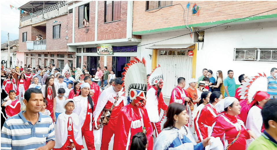
Figura 25. Desfile dominado por indios Pielroja, 2020

Que la parranda de matachines ya no sea organizada en el campo transforma su significado y representación. Los Pielroja dominan el paisaje (figura 25), y desaparecen casi por completo los gatos, perros, cerdos y otros animales que representaban un vínculo con la ruralidad. La parranda urbana se hace de espaldas al campo capitanejano, en el que la gente que queda está por fuera de las dinámicas comerciales de este plano: al acabarse el cultivo de tabaco por el cierre de Coltabaco en el 2019, y no hacer parte de la fiesta que interactúa con otros mundos, los habitantes rurales viven una especie de doble ausencia. La parranda de matachines organizada por el centro urbano pierde así potencia porque no dialoga con todas las dimensiones de un municipio con vocación agrícola. Ya no representa la fiesta del campo en lo urbano, ya no significa la hermandad o el desafío entre los campesinos y los comerciantes. Ahora representa y significa otra cosa. ¿Qué sentido tiene ahora ser un matachín?