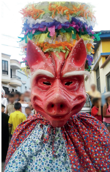
Figura 14. Matachín cerdo, 2017