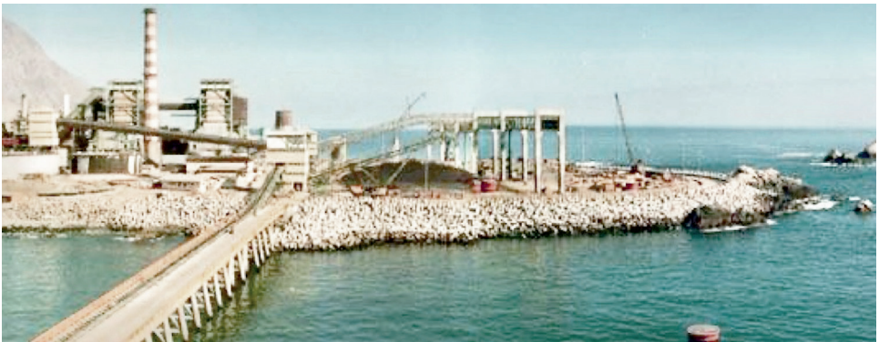
Figura 3. Vista del muelle en 1984 y zona del depósito de carbón