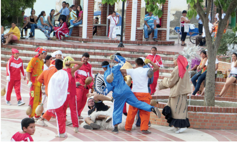
Figura 21. Correteada en el parque principal, 2014