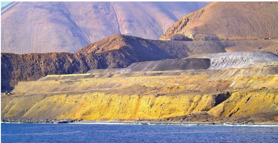
Figura 8. Vista de los cenizas desde la playa de Caleta Vieja, 2015