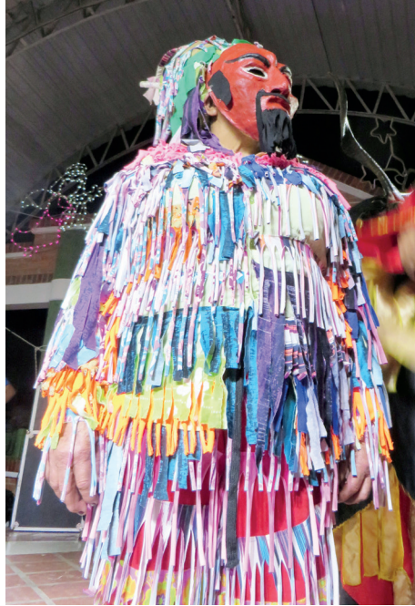
Figura 13. Matachín tradicional, 2014