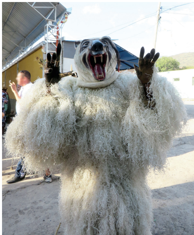
Figura 17. Josa chocando sus garras, 2014