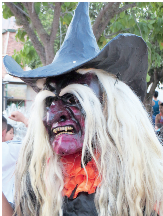
Figura 7. Bruja, 2014