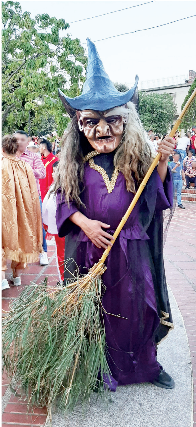
Figura 6. Bruja, 2022