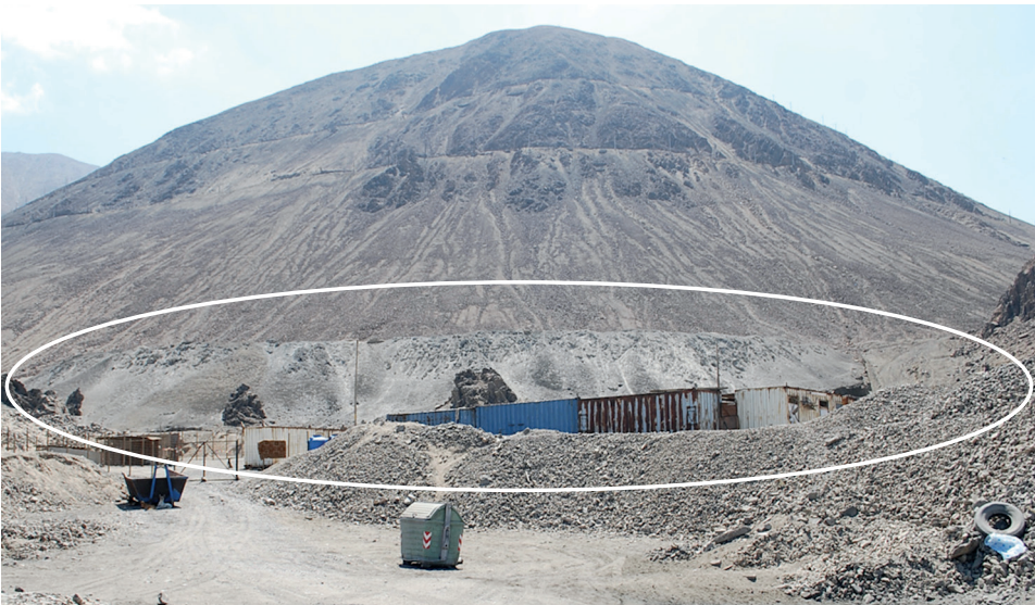
Figura 6. Segundo depósito de cenizas al pie del cerro La Cruz