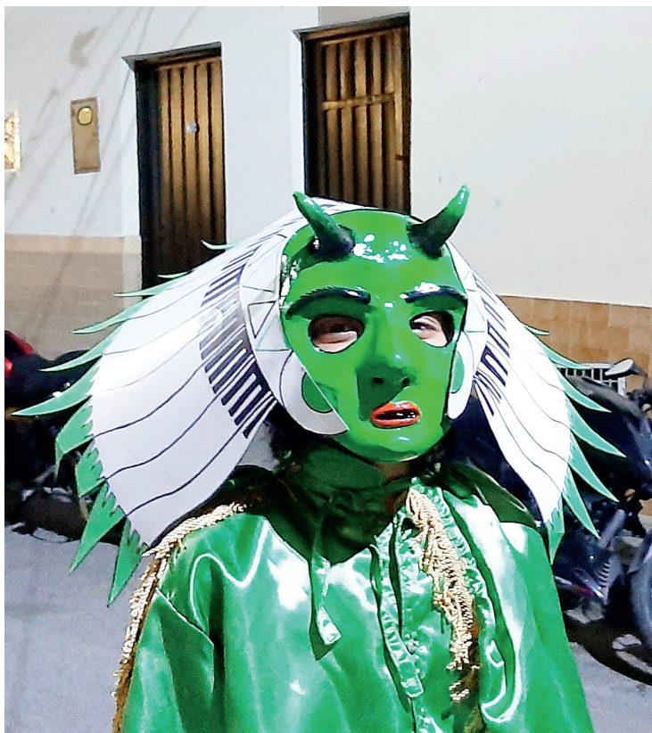
Figura 10. Pielroja verde con penacho hacia atrás, 2022