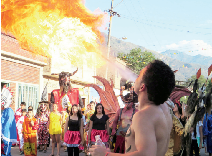
Figura 18. Desfile, 2014

y hechos en China. La espectacularidad de estos disfraces y la facilidad para acceder a ellos hacen que cada vez sean menos los de matachín; cada vez es menos fácil diferenciar la parranda de matachines de Capitanejo de un día de Halloween en cualquier lugar del mundo.