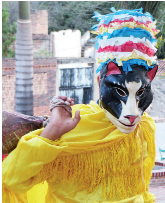
Figura 12. Matachín gato, 2014