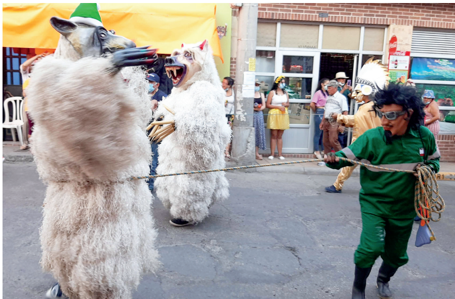
Figura 16. Josa y cazador, 2021