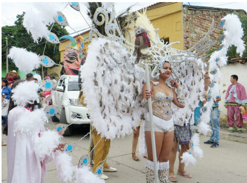
Figura 26. Traje tipo garota del carnaval de Río de Janeiro, 2019

Actualmente, la presencia de las mujeres sigue siendo mayor durante el desfile y prácticamente inexistente durante la correteada. Lucen trajes variados y, cada vez más, trajes tipo carnaval de Río de Janeiro (figura 26), por lo que son muy pocos los matachines mujeres. La inversión del orden establecido por hombres vestidos de mujeres y, en algunas ocasiones, por mujeres vestidas de hombres sigue haciendo parte de la construcción de otro mundo que emerge todos los días de la fiesta (figura 27).