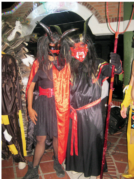
Figura 4. Diablos, 2012