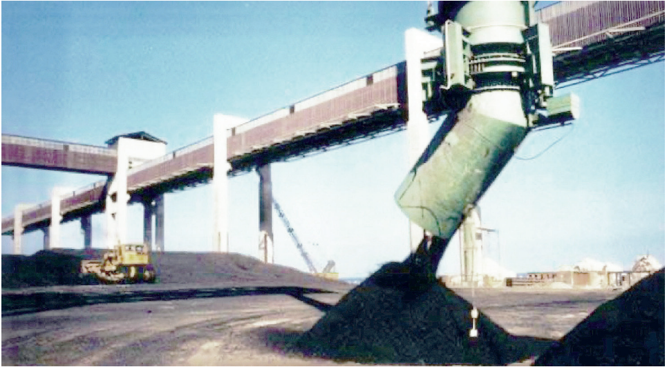
Figura 2. Descarga de carbón en campos de acopio mediante cinta transportadora

permitió a los operadores reducir los costos de generación de electricidad en un enorme 35 %, lo que garantizó que la extracción ilimitada de minerales siguiera siendo altamente rentable (Galaz-Mandakovic 2021; Andrews y Lattanzio 2013).