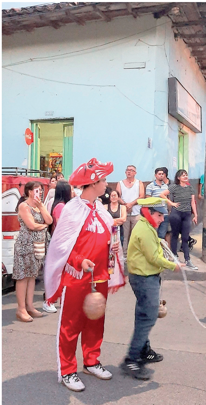
Figura 28. Careta puesta al estilo cachucha, 2023