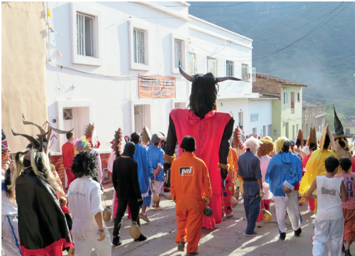
Figura 19. Desfile, 2014