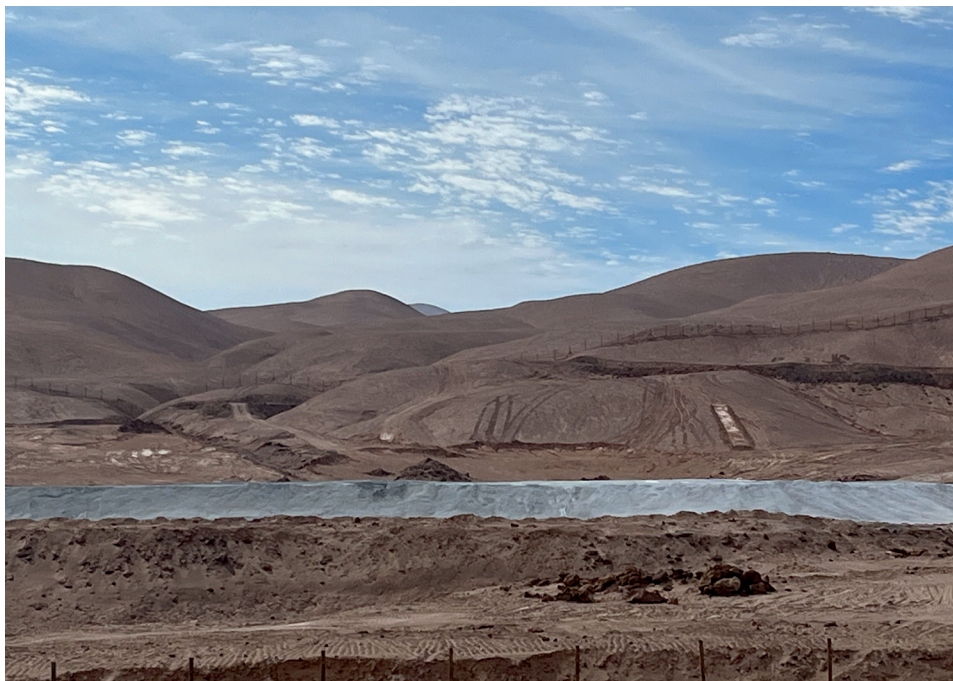
Figura 10. Ceniceros en Quebrada Ancha (ruta 24)

lo que cobra matices mucho más dramáticos si consideramos que aún no existe un mecanismo institucional para informar, rendir cuentas o reparar el exceso de morbilidad y mortalidad en Tocopilla. Las cenizas del Antropoceno ahora recorren 15 kilómetros al norte de la ciudad hasta la Quebrada Ancha (figura 10), transportadas, sea dicho, en camiones alimentados por combustible fósil. Este legado tóxico plagará a las futuras generaciones mucho después de la desaparición de las empresas energéticas.