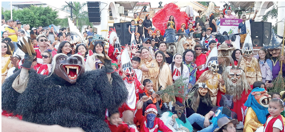
Figura 29. Parranda con pancarta de la Secretaría de Cultura y Turismo, 2022

asumió el rol de motivar su organización: es la plata pública la que paga la pólvora, el refrigerio, las cervezas, los disfraces, las máscaras y las vejigas (figura 29). Ante esta realidad, es posible afirmar que la parranda de antes se encuentra oficialmente extinta y que la que existe hoy en día significa y representa otras cosas.