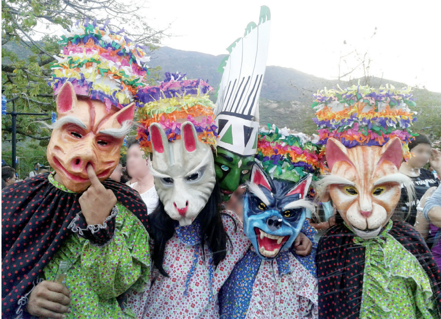
Figura 15. Matachines animales, 2017