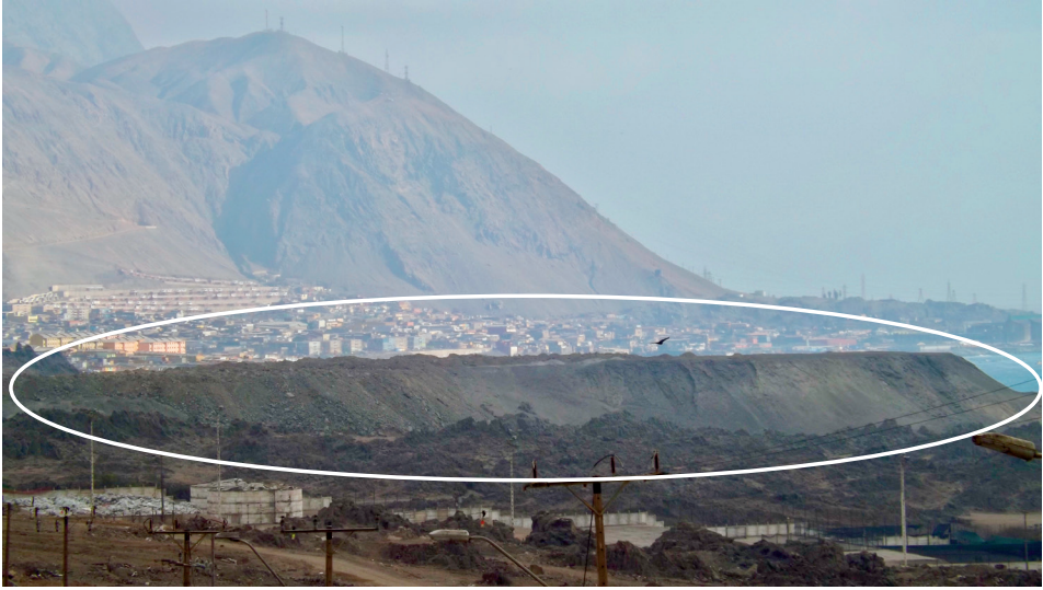
Figura 5. Primer depósito de cenizas en el límite norte de Pesquera Guanaye