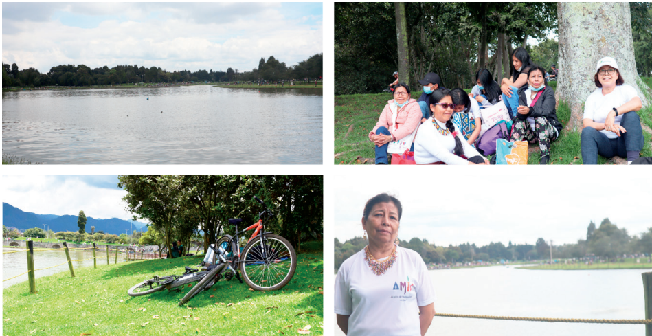
Figura 3. Ejercicio de elicitación fotográfica: aspectos territoriales y sociales de las experiencias de la AMIC en la ciudad, parque Simón Bolívar

El segundo aspecto que las mujeres expresaron durante el ejercicio de elicitación fotográfica tiene que ver con el desarrollo de sus procesos políticos. Retomando a Kernaghan y Zamorano Villarreal (2022), aunque las fotografías no revelan necesariamente el momento político que se viene desplegando, sí dan claves del encuentro empírico actual, que va más allá del sentido fáctico de la imagen, es decir, de los bordes de la representación. Las mujeres de la AMIC tienen un mayor conocimiento de la participación política en la ciudad, por lo que han logrado acceder a ciertas posiciones para gestionar acciones en beneficio de sus comunidades. La mayoría hace presencia actualmente en algunos espacios institucionales, como los consejos de planeación locales (CPL), en las casas de igualdad de oportunidades para las mujeres, y han sido cocreadoras de las mesas étnicas. Llegar a estas posiciones ha implicado la negociación con las autoridades de los pueblos y a veces también la rebeldía, porque los gobernadores y las mujeres aliadas con estos siguen controlando presupuestos y proyectos a nivel distrital. Por lo tanto, el grupo que continúa en la AMIC se ha dedicado más a los proyectos en las localidades, como una estrategia para avanzar en los microespacios, donde pueden tener algo más de incidencia que en los espacios distritales (comunicación personal, 30 de julio de 2023).