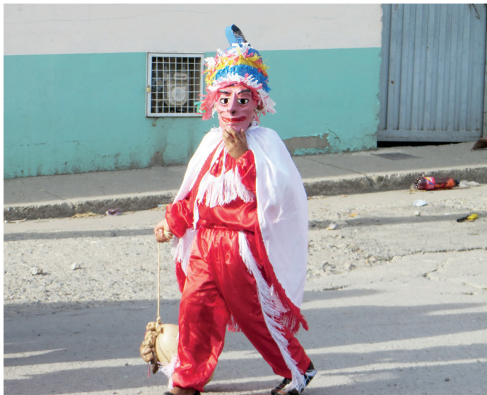
Figura 8. Pequeño Pielroja, 2014