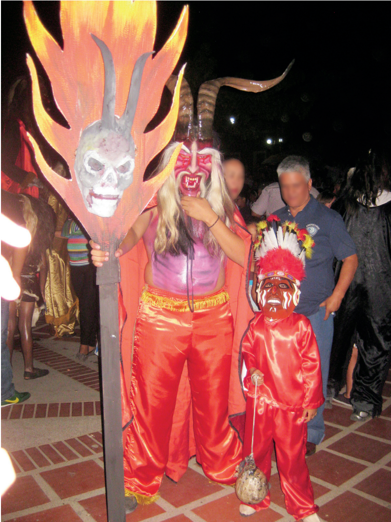
Figura 3. Diablo y pequeño Pielroja, 2011

recolectada a orillas del río Chicamocha. Sobre los moldes se “empapela”, una tarea de paciencia que los dedos de Drácula, acostumbrados al cultivo de tabaco, no conocen, y que por lo tanto suele ser realizada por su hermana Ana Milena Archila. La primera capa debe ser con papel “de azúcar” porque hace sudar menos y porque es menos “brusco” al contacto con la piel. Una vez seca, Drácula le da vida con los más variados colores y accesorios, añade el penacho en el caso de los Pielroja, el gorro en las brujas y los cachos de chivo en los diablos (figuras 3-7).