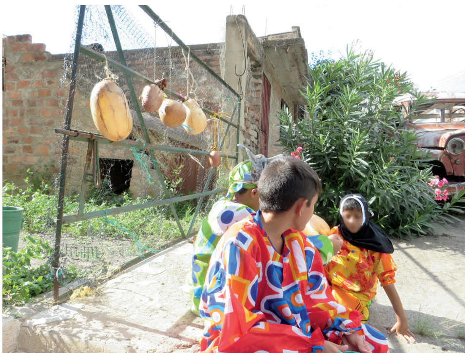
Figura 2. Vejigas al sol, 2014

Una vez inflada, la vejiga debe ponerse al sol para secarse (figura 2). El nivel de secado depende del gusto del matachín y del tipo de daño que se quiera priorizar: entre más seca, más duro pega, pero entre más húmeda, más feo queda oliendo el oponente. Las vejigas secas, además, corren el riesgo de reventarse más fácilmente. Pueden diferenciarse si se las observa con atención, pues, por ejemplo, las vejigas húmedas son más rosadas y con frecuencia tienen moscas encima. En cualquier caso, no suelen sobrevivir un día de parranda; si lo hacen, son puestas en remojo para ablandarlas en un balde de aspecto y olor que condensa la experiencia olfativa y sensorial de la fiesta, cierta atmósfera de “pichera” que la constituye. Es necesario ablandarlas para volver a inflarlas y secarlas, pues se desinflan de un día para otro. También, a gusto del matachín, pueden meterse una dentro de otra —hay vejigas “de a tres” o “de a cinco”—; entre más vejigas haya, más duro será el golpe.