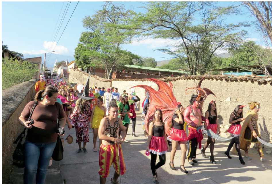
Figura 20. Desfile, 2014