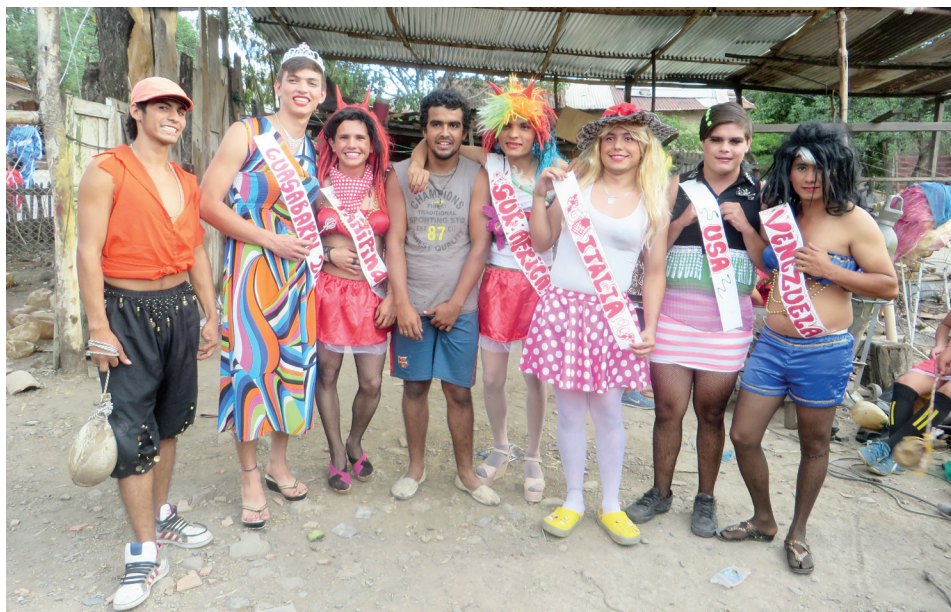
Figura 27. Hombres con trajes femeninos, 2015