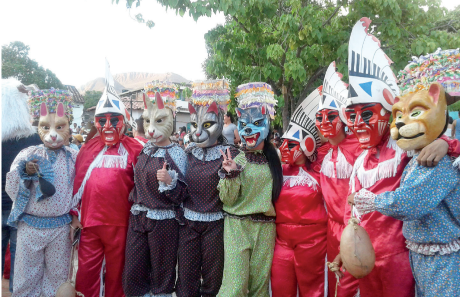
Figura 11. Indios Pielroja y animales, 2018