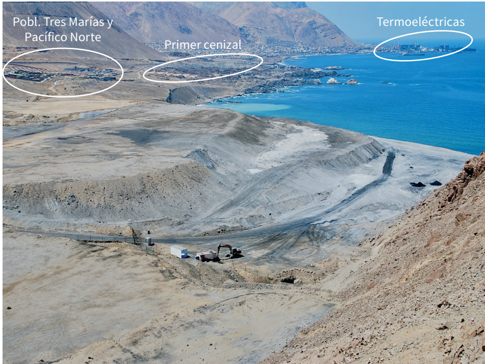
Figura 7. Panorámica de Tocopilla y sus cenizas